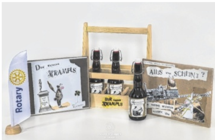
Die beiden Krampus-Bücher und das Christmas-Stout im Holztragerl

Im Mittelpunkt dieser Projekte stehen die Abenteuer des kleinen Krampus, dem Gehilfen des Heiligen Nikolaus, und seine manchmal etwas verquere Sicht auf die Welt. Das erste Buch „Der kleine Krampus sucht das Glück“ fand seinen Ursprung auf einer Geburtstagskarte zu einem Schmuckstück. Ein Jahr später wurde die Geschichte mit Illustrationen der Künstlerin Anette Smolka-Woldan aus St. Florian am Inn zu einem Buch. Nachdem das Buch im Freundes- und Bekannten-Kreis durch viele Hände gewandert war, entstand die